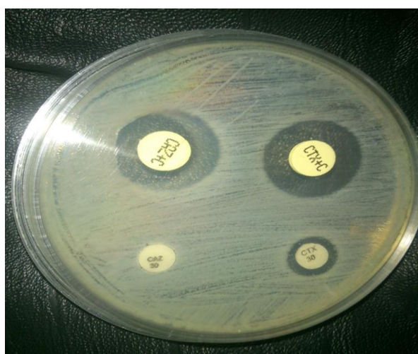
شکل ۱: نمایش افزایش هاله عدم رشد در ایزوله شماره ۳۲ E. coli با روش دیسک ترکیبی (Combined disk)

CTX: Cefotaxime, CAZ: Ceftazidime, CAZ+CV, Ceftazidime + Clavulanic acid; CTX+CV, Cefotaxime+ Clavulanic acid